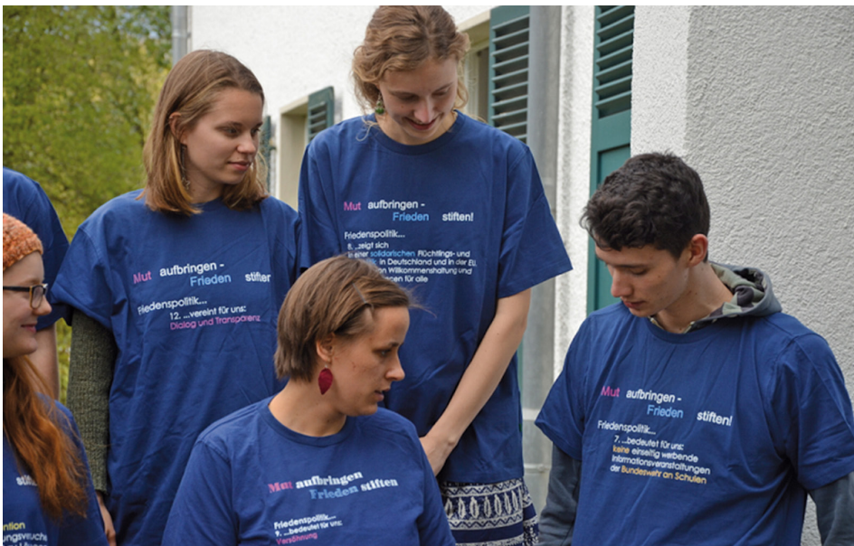
„Mut aufbringen – Frieden stiften“ wollen die jungen Peacemaker*innen

Nach den Reaktionen der Schüler*innen gefragt, berichtet die Jugendbildungsreferentin, dass sie, gerade wenn es um Israel und Palästina geht, oft klagen, dass es unglaublich kompliziert sei, diesen Konflikt überhaupt zu verstehen. Hier ist für Subasic der Punkt, um zu bedenken zu geben: „Daran kann man erkennen, dass ein rasches militärisches Losschlagen keine Lösung bringen kann. Wenn man