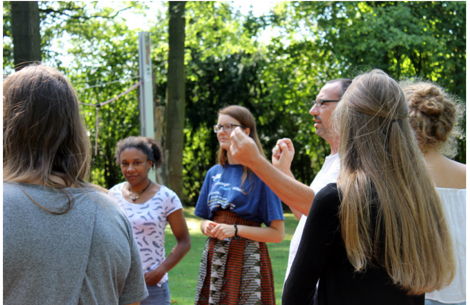
Planungsrunde von Peacemaker*innen im Hackhauser Hof, Foto: ESR

Zum andauernden Konflikt zwischen Israel und Palästina verweist Subasic auf die Gruppe „Breaking the Silence“, in der israelische Ex-Soldaten über