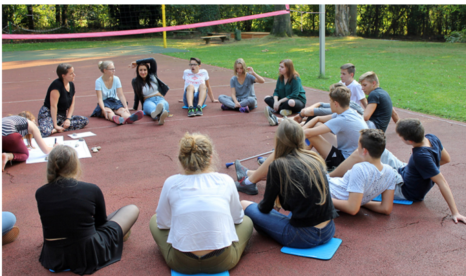
Diskussionsrunde von Peacemaker*innen in der Solinger Jugendbildungsstätte Hackhauser Hof, Foto: ESR

Unser Eindruck nach vielen Gesprächen ist, dass Lehrer*innen einerseits durch die Lehrpläne so eingengt sind, dass sie im Unterricht keine Zeit