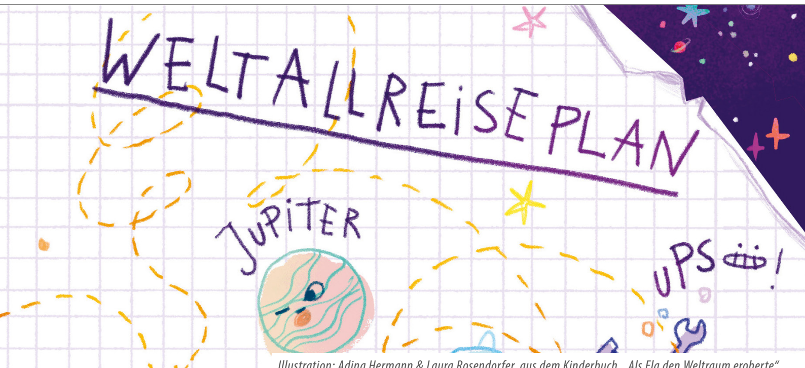
Illustration: Adina Hermann & Laura Rosendorfer, aus dem Kinderbuch „Als Ela den Weltraum eroberte“